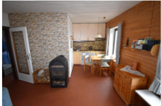
Wohnen mit offener Küche