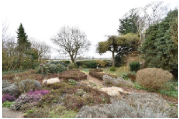
Garten vor dem Haus