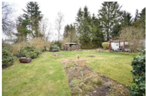
Garten hinter dem Haus