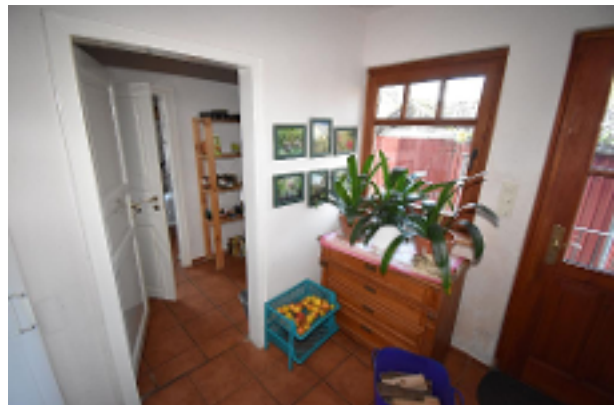
2. Flur EG