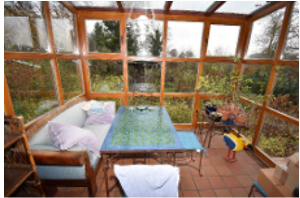
Wintergarten hinter der Küche