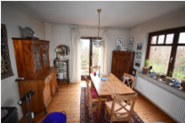
Wohn- un Esszimmer