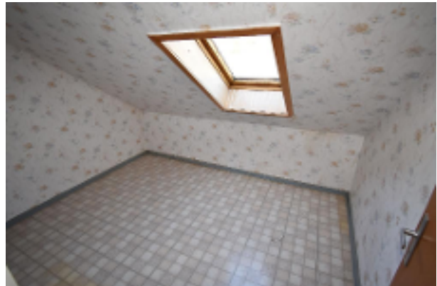
Zimmer 1 DG