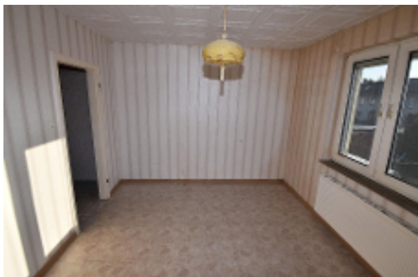
Schlafzimmer 1. OG