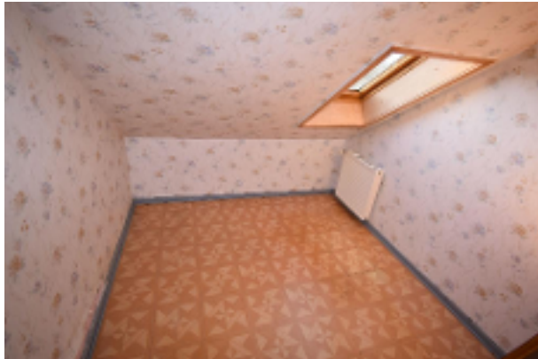
Zimmer 2 DG