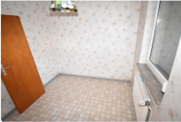
Zimmer 2 1. OG