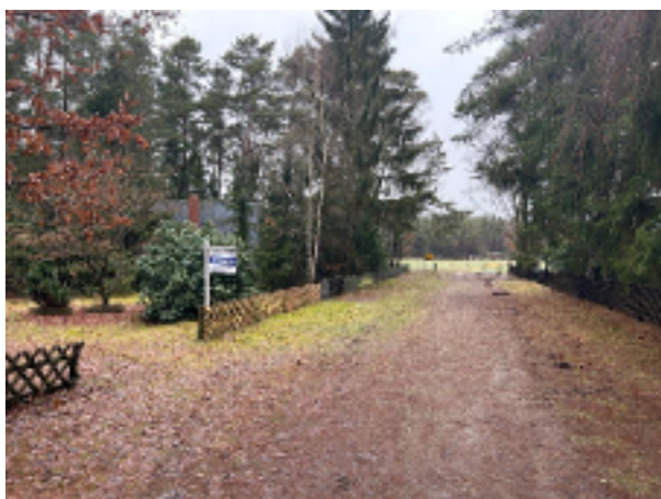
Weg vor dem Haus