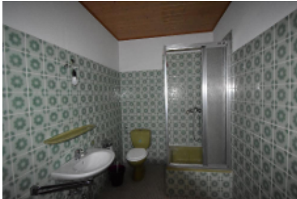
exemplarisches WC Privaträume