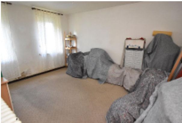
Unrenovierte Räume EG