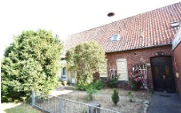
Setenansicht ältester Gebäudetrakt