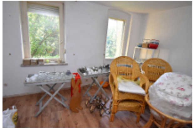
unrenovierte Räume EG