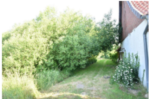
Zuwegung hinterm Haus