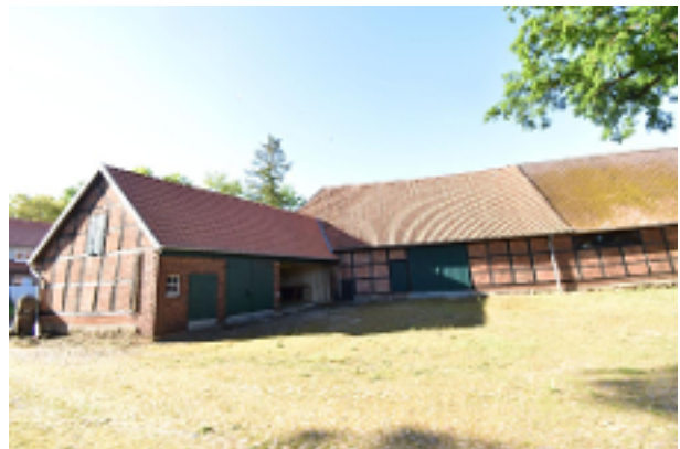
Garagen und Scheune