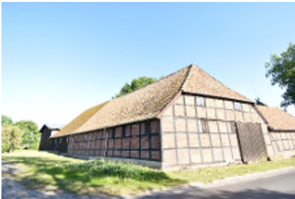
Fachwerkscheune am Ortsrand