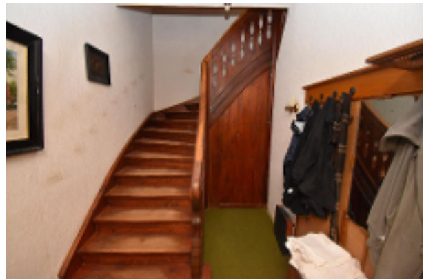
Treppe in das OG