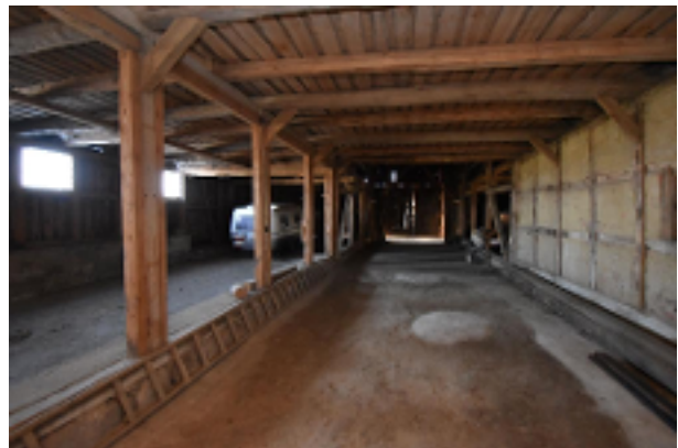
Große Scheune - innen