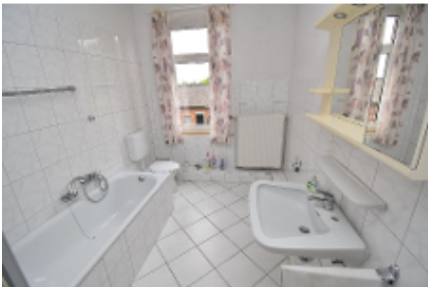
Vollbad im OG