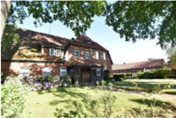
Wohnhaus auf der Haupteingangssseite