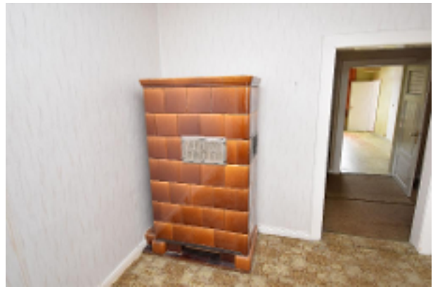
Ofen im Obergeschoss