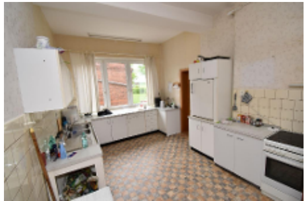
Küche im EG