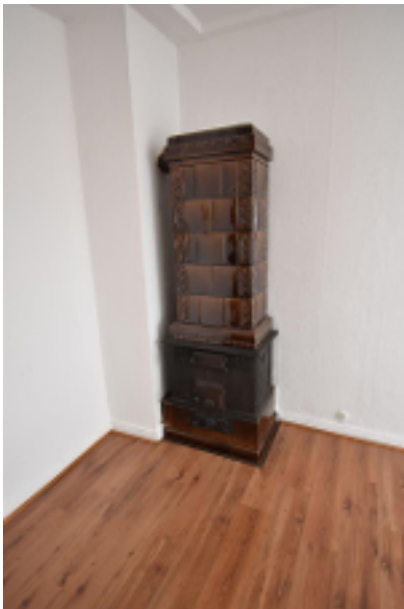
Ofen im Obergeschoss