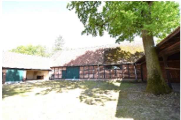
Hofstelle mit Fachwerkscheune