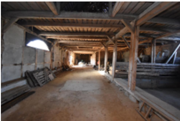
Große Scheune - innen