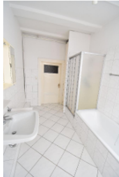
Vollbad im OG