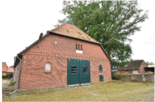
Giebelseite Hauptgebäude Stallseite