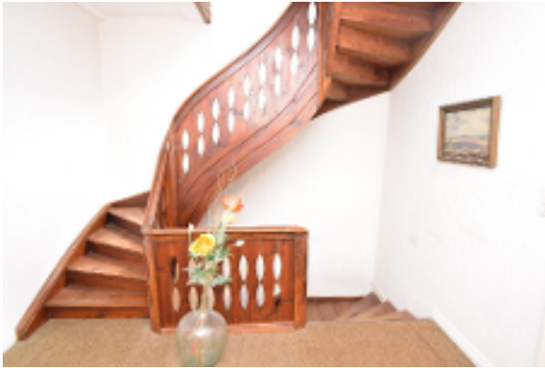
Treppe vom OG in das Dachgeschoss