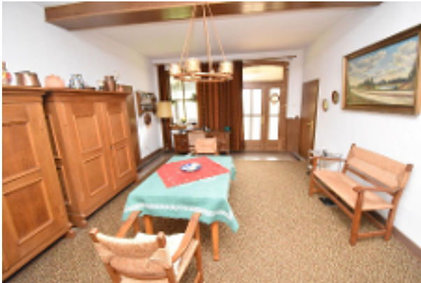
Diele im EG