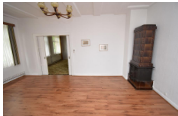
Wohnzimmer II OG