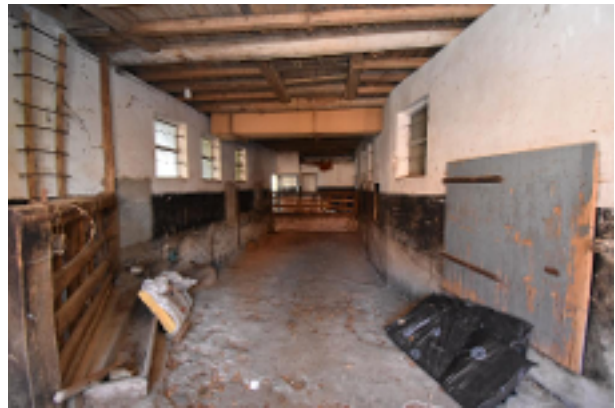
Stallteil am Wohnhaus