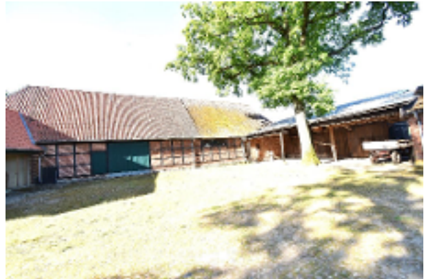
Hofscheune und Remise