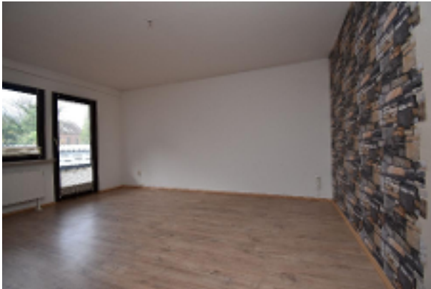
Zimmer einer der Wohnungen