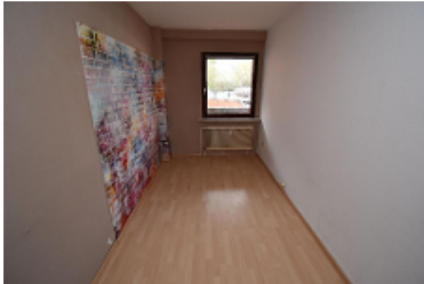
Zimmer in einer der Wohnungen