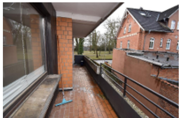
Balkon einer der Wohnungen