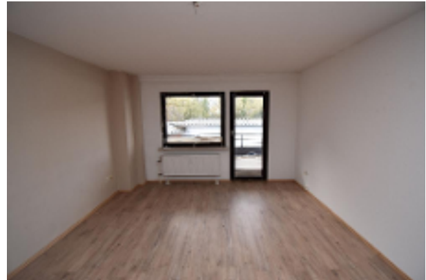
Zimmer in einer der Wohnungen