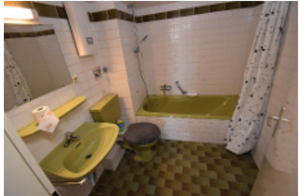
Bad einer der Wohnungen