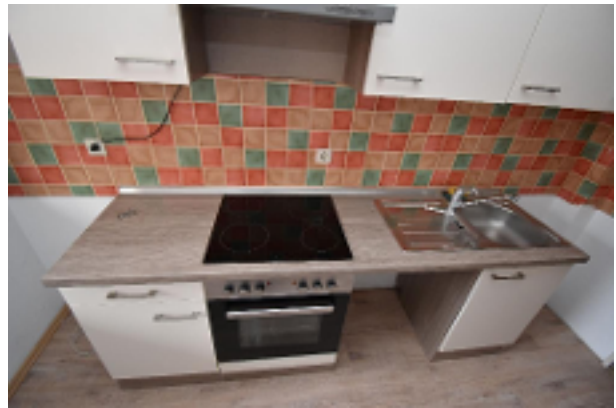
Küche einer der Wohnungen