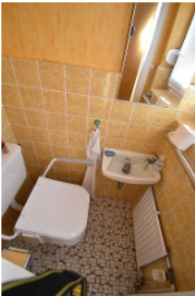
WC im OG