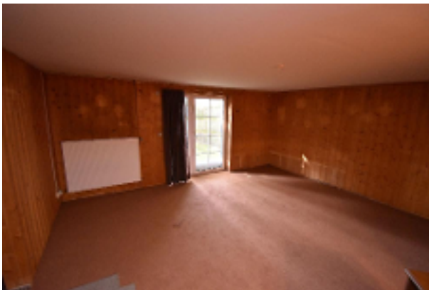
Wohnliches Zimmer Keller