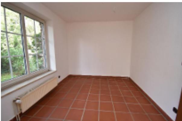
Essecke Wohnzimmer EG