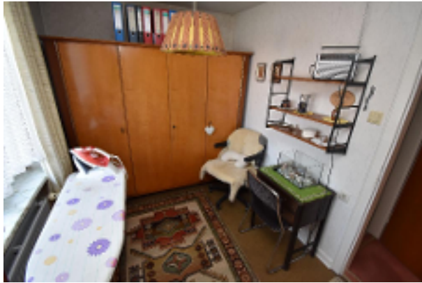
Büro 1. OG