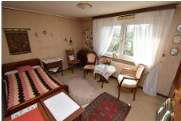
Schlafzimmer 1. Obergeschoss