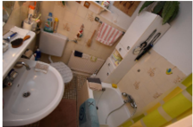
Wannenbad 1. OG