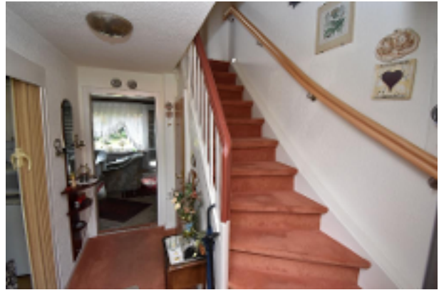
Flur mit Treppe EG